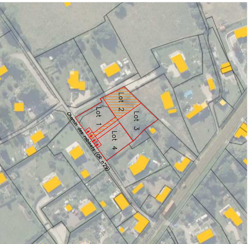
Plan de situation sans échelle